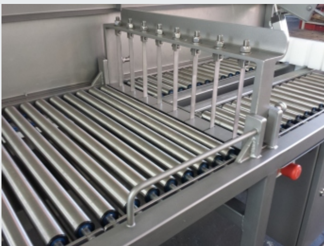
Edelstahl-Rollenbahn und Messerblock

Schnittbreiten von 30 bis 100 mm, Schnittlängen bis 600 mm wählbar. Taktzeiten bis 10 Stck/Minute.