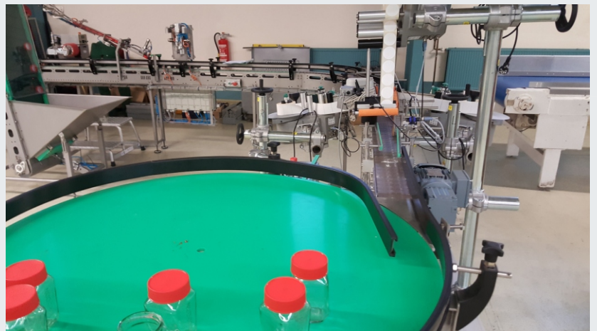
Etikettierung und Rundtisch