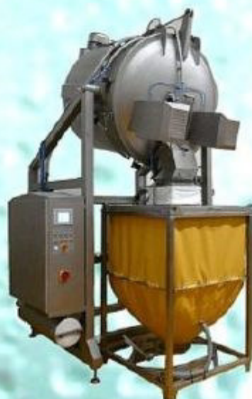
Mischer mit 750 Liter Container