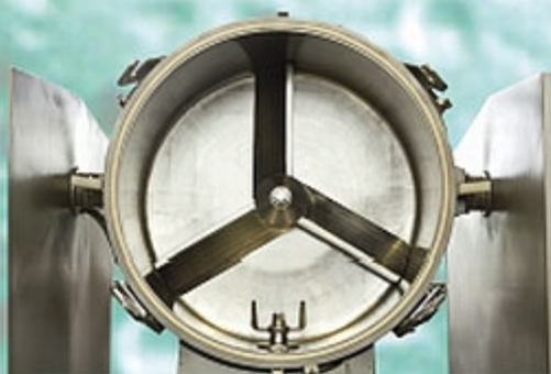
Mischbehälter mit Messer