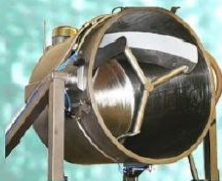
Behälter mit Mischwerk