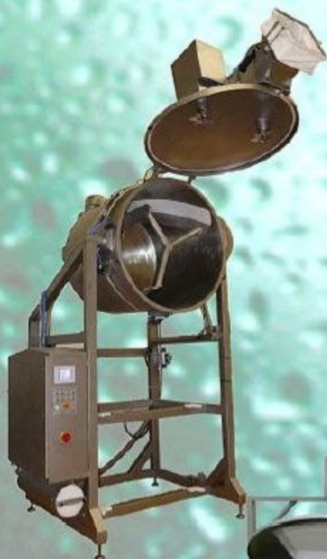
Mischer mit offenem Deckel