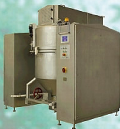
Ausgangstellung Einfahren / Ausfahren