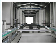
Wasch- und Trockenstraße