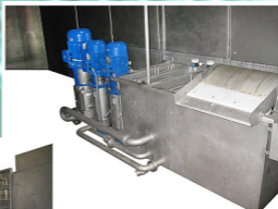
Filteranlage mit Pumpenstation