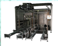
Ausfahrstation mit Stapelroboter